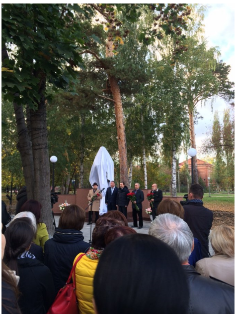
Перед открытием памятника в Скрятинском саду