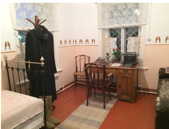
Комната Пастернака, расписанная, ласточками, в Мемориальном музее