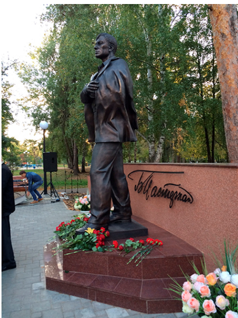
Памятник Пастернаку. Скульптор Владимир Демченко